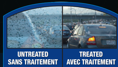
UNTREATED SANS TRAITEMENT